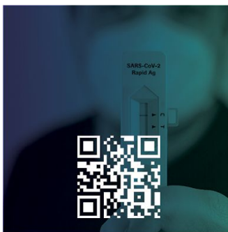
မၤလိာ်တၢ်မၤကွၢ်တဖၣ်