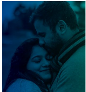
ကလေးမယူမီ