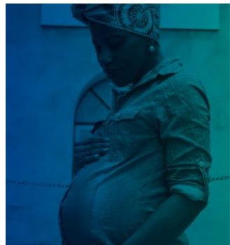
သင်သည် ကိုယ်ဝန်ဆောင် နှစ်စဉ်