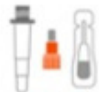
1 Empty Tube and 1 Sealed Solution