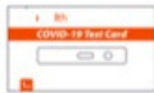
1 COVID-19 Test Card in Pouch

بسته را باز کنید، کارت تست کووید-19 را از کیسه درآورید، تیوب پر شد از محلول استخراج و سواب را درآورید. هر گاه آماده انجام تست شدید، کیسه فویلی کارت تست کووید-19 را باز نمایید.