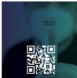
परीक्षणहरू अर्डर गर्नुहोस्