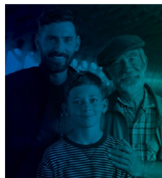
КОЛИ ВАШІ ДІТИ ПІДРОСТУТЬ